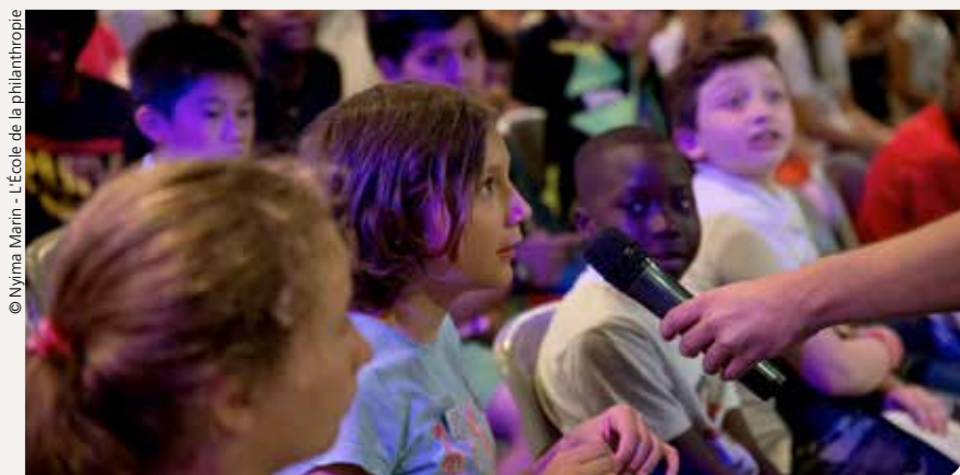
© Nyma Marin - L'École de la philanthropie

Partager et valoriser l'engagement des élèves.