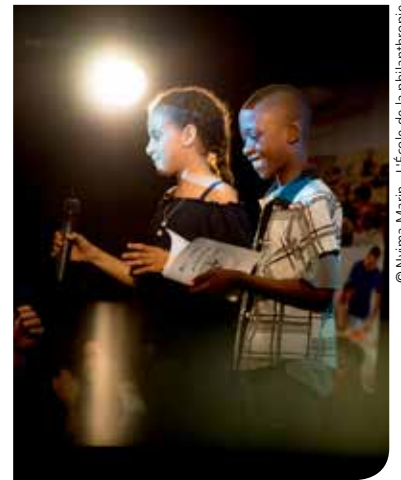
© Nyima Marim - L'École de la philanthropie