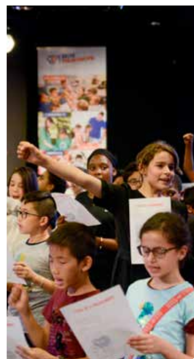
© Nyima Marim - L'École de la philanthropie