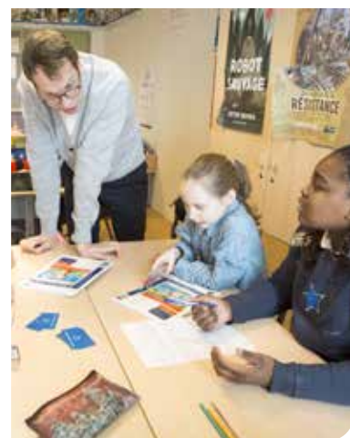
© Marion Pouliquen - L'École de la philanthropie