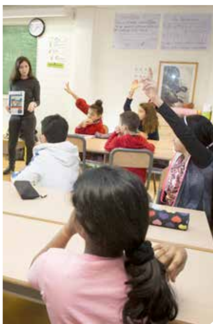
© Marion Poulliquen - L'École de la philanthropie

L'association L'École de la philanthropie forme des enseignant(e)s et des bénévoles avec la Ligue de l'enseignement de Paris pour leur donner les moyens d'enseigner la philanthropie aux élèves de cycle 3 (CM1-CM2). Elle leur propose des ressources pédagogiques répondant au socle commun de compétences, de connaissances et de culture, et aux programmes de l'Éducation nationale.