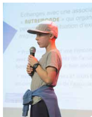
© Marion Pouliquen - L'École de la philanthropie