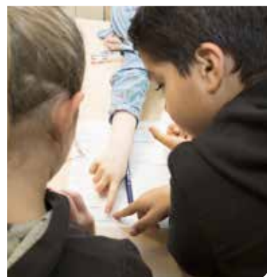
© Marion Poulliquen - L'École de la philanthropie