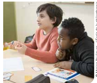
© Marion Pouliquen - L'École de la philanthropie