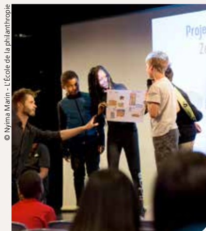
© Nyma Marin - L'École de la philanthropie