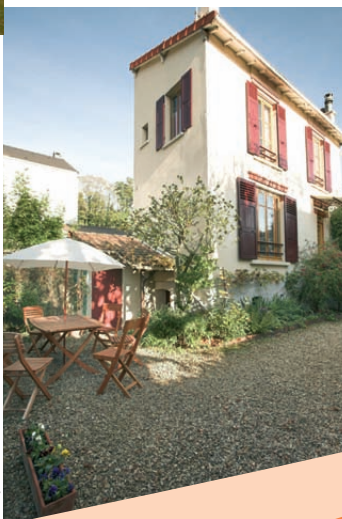
Meublé Le Pavillon de Diane à Joinville-le-Pont