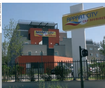
Appart'City Cap Affaires Alfortville