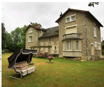
Chambre d'hôte La demeure de la Pompe à La Queue-en-Brie