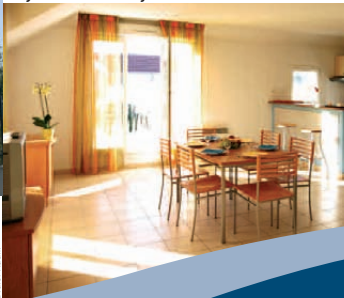
City résidences de Bry