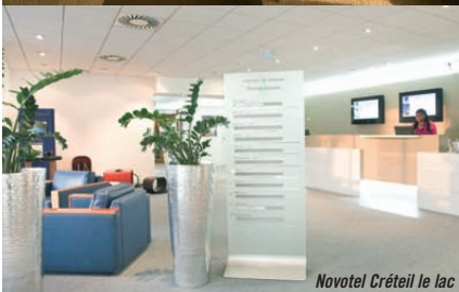
Novotel Créteil le lac