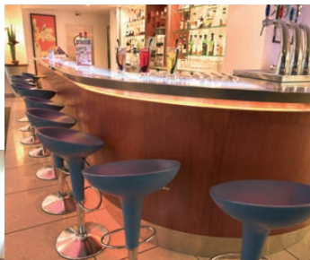
Novotel Créteil le lac