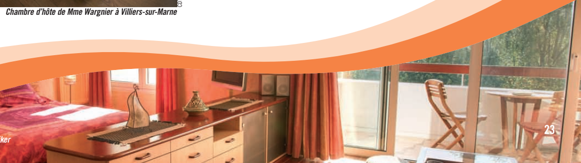
Chambre d'hôte de Mme Wagnier à Villiers-sur-Marne