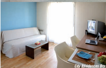
City Résidences Bry