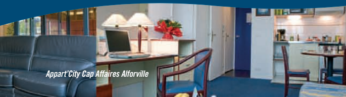
Appart'City Cap Affaires Alforville

*capacité assis/en cocktail de la plus grande salle