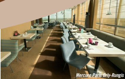
Mercure Paris Orly-Rungis