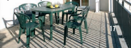
City Residence de Bry