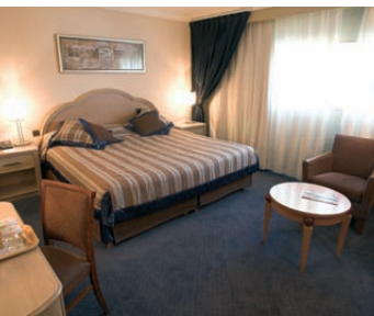
Holiday-Inn Orly Airport

*nombre de couverts/menu à partir de **capacité assis/en cocktail de la plus grande salle