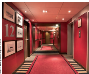
Mercure Paris Orly-Rungis

*Coût de la communication à partir de 34 cts/min **Coût de la communication à partir de 30 cts/min